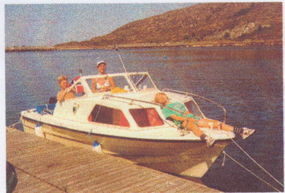
Vi har hatt mange fine turer i båten i sommer (bortsett fra en over Kråkvåg-fjorden). Her soler vi oss ved kai i Hestvika.