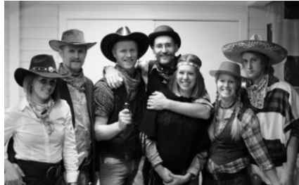
Her er søsken og svigerinner og svoger på Westernfesten.

feiret sin 30-årsdag i år. Riktignok et år for sent, men det ble en skikkelig western-fest med hele gjengen.