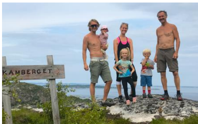
Kosedager sammen på Moldtun.