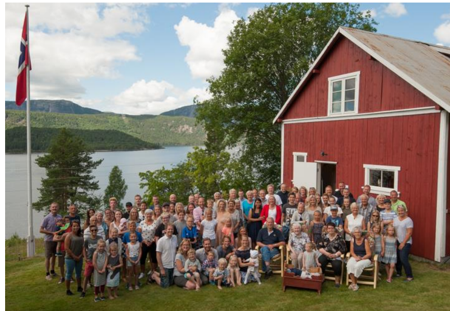
Slektstreff på Rønningen