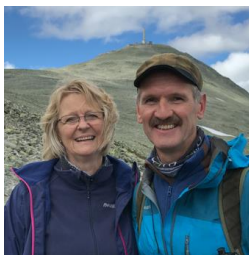
Bilde fra en finfin tur på Gaustadtoppen før vi dro over Hardangervidda til vestlandet i sommer.

Hun arbeider fortsatt ¾-stilling på Nidarvoll og kommer hjem litt frustrert innimellom. Endringer og stadig færre på vakt gjør at hun ikke syns hun får gjort jobben godt nok for de som behøver det.