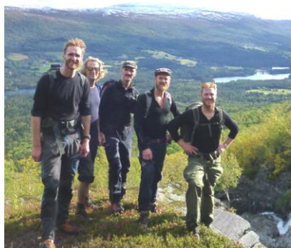
Bilde fra guttetur til Bjorli og Dovre i høst.

prøvde å trappe ned, men er nå tilbake i full jobb og vel så det igjen. Det var ingen som gjorde jobben når han var borte, så da ble det bare mer stress og mindre betaling. Nå er det bare stress... Arbeidsplassen flyttet forresten fra Sluppen til Ranheimsvegen nettopp.