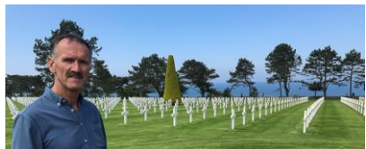
Det er 9386 marmor-kors på den amerikanske krigskirkegården.