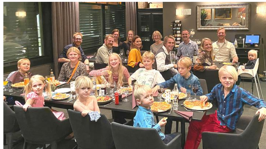
Hele gjengen samlet

«En rekk itj stort mer inn å ta i mot lønn og å hogg jul'tre». Det var det en som sa, og heldigvis stemmer nå ikke det helt selv om en føler tiden går altfor fort.