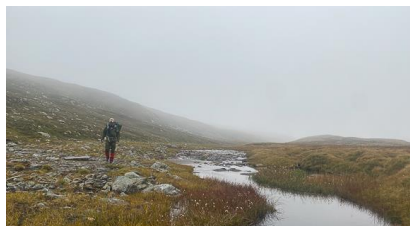
Reinsjakt i regn og tåke